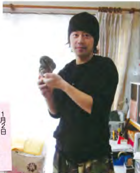
1月2日 「10年たんぱらっし や〜☆」に出演