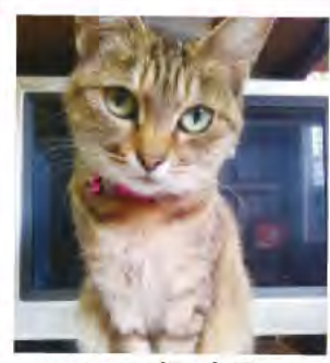
名張市黒田/ にゃんこちゃん