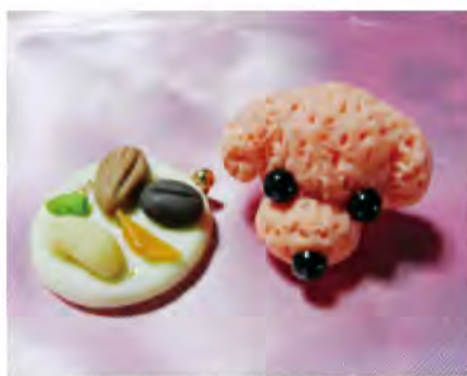
色合いだけでなく、質感も本物のお菓子そっくりに。

5年ほど前に、「これなら自分にもできる」と独学で始めたフェイクスイーツ作り。すぐに夢中になり、寝るのを忘れてしまふほど作品作り