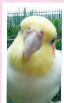
名張市桔梗が丘/ チーコちゃん

自慢のペット写真をお送りください! 住所・氏名・ご連絡先・ペットの名前・性別を添えて、郵送またはEメールで下記のあて先までお送りください。 ※写真はご返却できませんので、あらかじめご了承ください。 【あて先】 〒518-0444 名張市箕曲中村18-2 (株)アドバンスコープ メディア事業部 「nava VIP」係 Eメール:guide@asint.jp