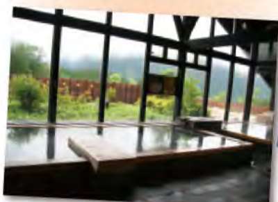
木の浴室(左)と石の浴室(右)