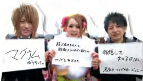
▲名張市 ゆうすけさん・おまたさん・くっしーさん

『なるほど! NABARI』(月~木 16:00~19:00放送)の各ナビゲーターが1つのテーマからトークを展開する「○○な話」のコーナー。木曜日は地域の声をお届けします! 掲載したみなさんのインタビューは2月14日(木)に放送しました☆