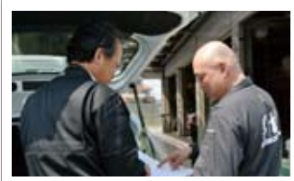
修理対象車の損害箇所をどう修理するか、保険会社の担当者と確認・打ち合わせ。

ずっと勉強です。今よりもっと高いクオリティを求めて、時代や環境に合った工場づくりをしていきたいですね。そして、お客様に信頼され、喜んでいただきたいですね。