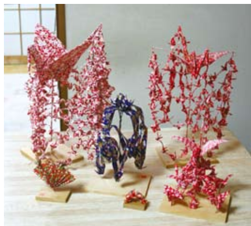
一番大きな作品(左奥)では 260 羽の鶴が連なっている。

美しい和紙で折られた鶴が縦横に連なり、上品な華やかさを醸し出す「連鶴」。折ってからつなげるのではなく、一枚の紙からできるというから驚きた。