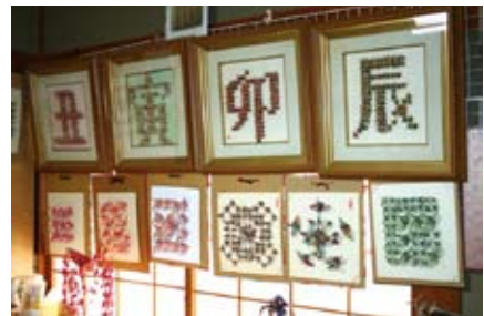
文字を作るときは鶴の四隅をつなげており、「折るのは一番大変」という。

の女性住職に習うこと3カ月。その合間にも個人的に住職を訪ねて教わった。今では、自分で考えた形に折るために図面から作成し、作品を完成させるという。