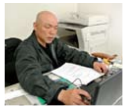
打ち合わせ後、書類を手にパソコンに向かい見積もりを作成します。

この仕事は、傷ついたものを「復元」して現状に戻すというのですが、修理を終え、お客様に納車した時はお客様も自分も満足できる。お客様に喜んでもらった時が本当にうれしいですね。