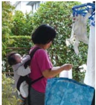
ズボラな私が毎日せせと洗濯しました。いい思い出です。

はかなり達成感を味わわせてもらえました。昨今、紙おむつは、より長時間対応へと開発が進んでいます。しかし「おむつ汚れてないかな？」と何度も何度もチェックしてもらって、少しでも汚れていたら惜しみなく洗いざらしのおむつに交換してもらうのは、子どもにとって気持ちいいことです。子どもにいいことをしているという思いは、たとえ仕事が増えても母の心を救います。全てが完璧な出産育児なんてありません。だからこそ、布おむつで育児ができたことに感謝です。