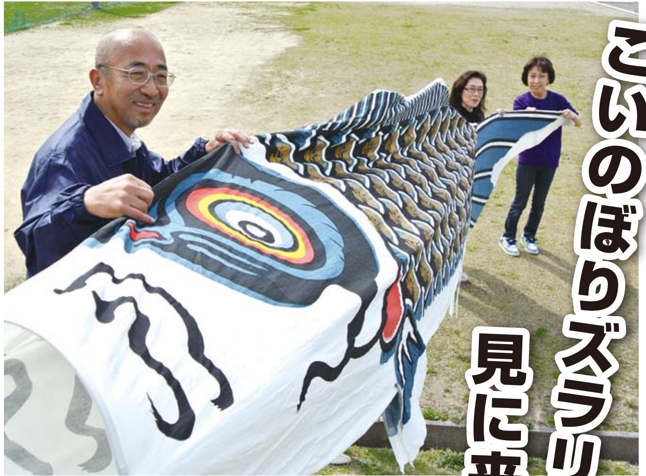
年代もの、の真鯉。全長も5m以上のビッグサイズだ。