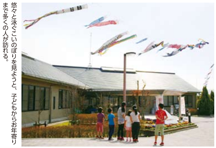
悠々と泳ぐこいのぼりを見ようと、子どもからお年寄りまで多くの人が訪れる。

「端午の節句」を前に、名張市百合が丘西5番町の百合が丘市民センターでは、数十匹のこいのぼりがズラリ。風を受けて悠々と泳ぐ姿は、地域の人たちの目を楽しませている。