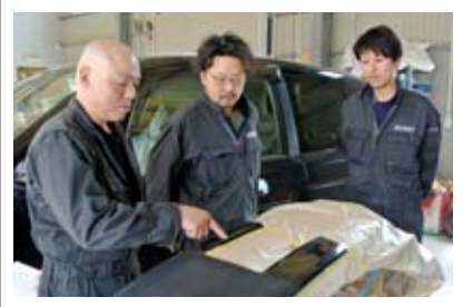
作業工程の最終チェック。塗装内容をスタッフに確認します。

車両の事故修理など、傷んだ部分を钣金や塗装で直します。修理車もメーカー、車種問わずです。