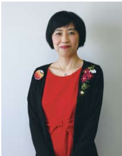
「ヒーロヤラドンドン」ってお祭りの音を表すでしょ、そのヒーロヤラの部分が篠笛です。日本人のDNAに深く刻まれている音色だと思っんです」という井上さん。

「ただ初対面の人に対してガチガチに緊張してしまうところは、直したいです」と苦笑い。