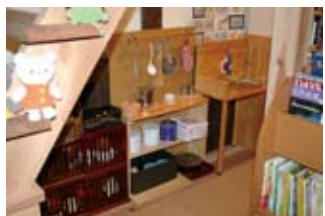
親子で訪れた時、子どもが遊べるようにと、小さなキッチンも。

店内には絵本を卒業した子どもや大人向けの本もずらり。「時期が来たら、『絵本』から移行して、心をゆ