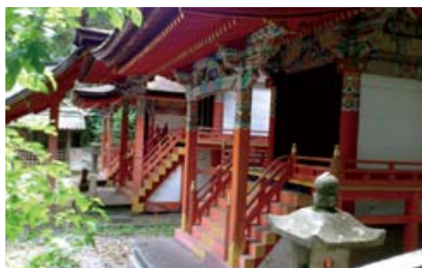
桃山時代の装飾が華麗な高倉神社の社殿。

行者が乗り込み漂流するといった命がけの捨て身の行とされた。和歌山県那智勝浦町の補陀落山寺(ふだらくさんじ)が渡海の霊場として名高いですが、伊賀市西高倉の補陀落寺は、17世紀後半には、すでになくなっていました。平安時代後期から鎌倉時代にかけて熊野信仰が流行していたことや、熊野に縁のある高倉神社が近くにあることなどが、補陀落寺創建の背景にあったと考えられています。補陀落寺跡の近くには、