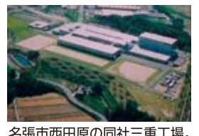
名張市西田原の同社三重工場。

近年の流行色に合わせた商品塗装設備の更新や製造ラインの工程設計、天然ガス使用でのCO 2 削減など、「商品の安定供給」「コストの極小化」「環境に配慮したエネルギー」の三本柱を掲げ工場改革を目指す同グループ。時代の流れとともに求められる商品の変化に合わせて、彼らの取り組みは続く。(PR)