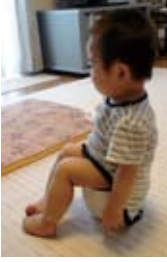
こんなふうにはしゃぎと座っていられます。2歳頃には裸で自分でするようになってきました。

毎日何度も「そろそろかな?」とおまるに座らせて、もちろん排せつしないことも多いですが、親子のタイミングがバッチリ合った時の爽快感は、子育ての醍醐味(だいごみ)を味わっているなと感じました。また、よく「おしっこはおまるにできるのに、うちはオムツにしたがる」という話を聞きますが、オムツなし育児をしていたおかげでうちの方が先に上手にできるようになりました。それってすごく楽しいことです。小さいお子さんがいる方は、ぜひおまるでさせてみてください。きつというんな気付きがあるはず。