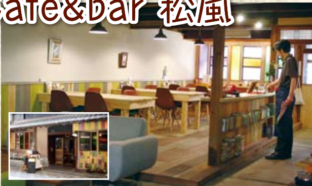
森本さん自らも、改装に汗を流した店内。