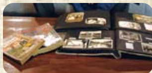
古い雑誌やアルバムも「ご自由に」。

【TEL】44-6355 【所在地】名張市上本町34 サンロード商店街内 【営業時間】8:00~21:00 【定休日】木曜日