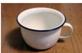
ポット...始めるにあたって購入しました。インターネットで「ホーローおまる」で検索できます。

オムツなしと言っても完全にオムツをしないで育児をするのではなく、基本的に布オムツをしていて、子どもが排せつをしそうなタイミングを見計らっておまるに座らせるというやり方です。私は生後6カ月から始めましたが、新生児から始めら