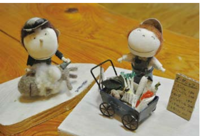
表情豊かに「日常の風景」を伝える人形たち。

身近にありそうで、一昔前の懐かしさも感じる人形たちは、作り始めて十数年。ぬくもりのある表情になるようにと、目の位置一つ一つにも試行錯誤。少しずつ動かして、「一番の表情」を作るそう。