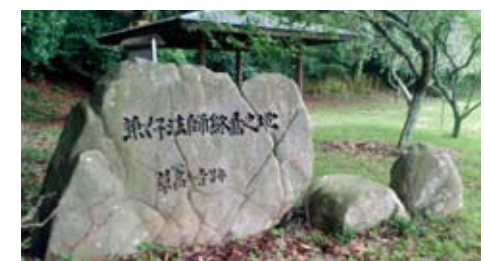
伊賀市種生の草葺寺跡に建つ石碑。

「徒然草」といえば、世の無常観をつづった随筆集ですが、その38段に「金は山に棄て、玉は淵に投ぐ(なぐべし)」とあります。財産や名譽の虚しさを詠んだ一節です。兼好塚の近くでは「膏薬石(こうやくいし)」と呼ばれる石があります。この膏薬石は蛋白石(オパール)ともされているようですが、兼好のいう「玉」とは違い、宝石としての価値はないようです。