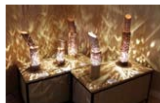
幻想的な光が美しい「竹の銀河」。

意欲はとどまることを知らない。「以前、「アイデアが」無尽蔵だね」と言われたことがあるんだよね」と笑う三代澤さん。「これからも日々創