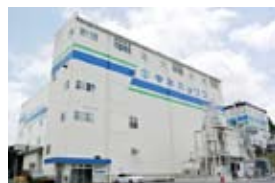
名張市蔵持町原出の同社名張工場

ザインを施し、成型を担当する他社工場へフィルム状で出荷。名張工場では、1カ月で容器など3億個分のフィルムを生産している。 また、同社が「クリーン&セーフティ」を掲げる中、名張工場では、5年前から不良品などのプラスチックを粉砕して再利用を進めている。国内5工場分、1カ月約150トをリサイクルするそうだ。 商品を手にするきっかけにもなる容器やパッケージ。調理時の耐熱性や冷凍保存への耐寒性など、進化を求めて続く開発に「安全性はもちろん、食品が入った時のイメージや色へのこだわりも譲れない」と、作り手の社員たちの思いは熱い。(PR)