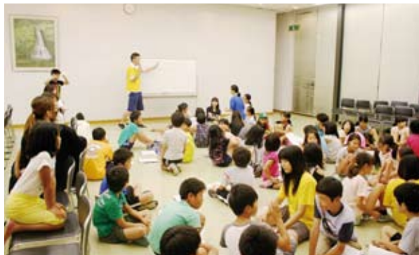
グループに分かれ、子どもたちをまとめるキッズサポーター。

(あん)さん。中学1年の時、当時の校長からの勧めがきっかけで同クラブに入った。以来7年間、自分たちで企画したウォークラリーやたこあげ、林間学校をはじめ、宿題の補助など、さまざまなイベントで活動。高校では、バスケットボール部のマ