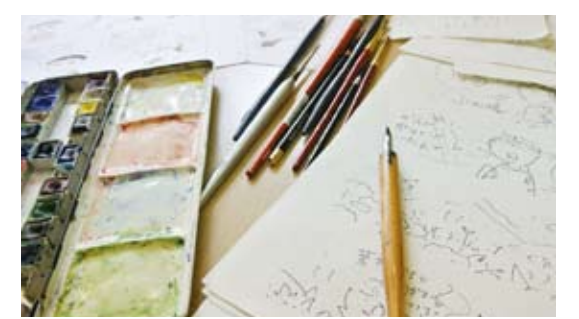
作品づくりは下絵（右下）から。Gペンで清書後、水彩絵の具で色付けする。

散歩から。毎日、自宅の近所を歩いては、草花の成長や小さな生き物たちの出合いを楽しむ。うだ。「ゆるやかなユースがある、ネタは尽きない。よく散歩ついでに來ては、青山公民館を『アトリエ』にして、描かせてもらっています。これまでには、同公民館や地域の金融機関などで作品展も開催。「かわいらしい」「懐かしさを感じる」などと好評を得ている。