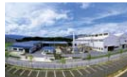
名張市八幡の同社名張工場

時代や取引先のニーズに応じて、研究を重ね、新しいものを生み出し続ける菊水テープ。名張工場は、ひらめき力と技術力で同社の発展を支えている。(PR)