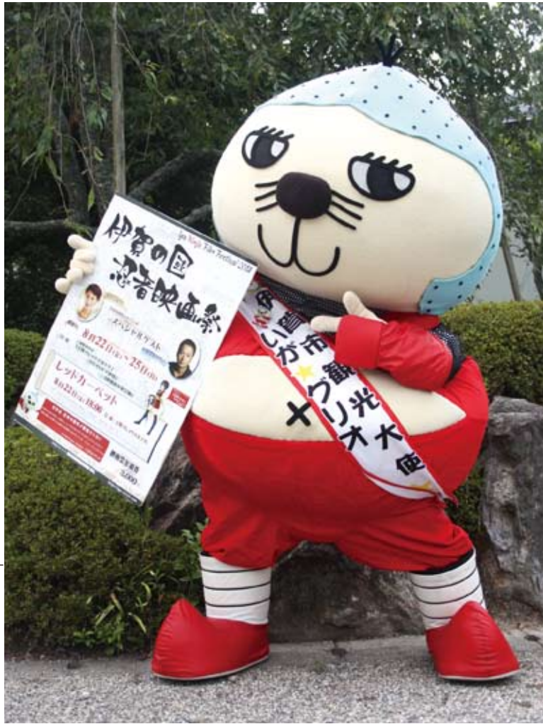
同映画祭実行委員長のいが☆グリオくん。