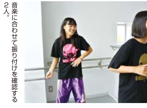
音楽に合わせて振り付けを確認する2人。

踊るのは、ヒップホップやブレイキングなどの「ストリートダンス」。「2人だけの舞台は緊張するけど、応援してもらおうという気持ち」という2人は、姉妹ならではの「あうんの呼吸」でダンスの息もピッタリだ。