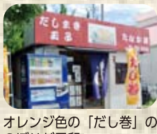
オレンジ色の「だし巻」ののぼりが目印。

【TEL】63-0126 【所在地】名張市平尾2992の2 (名張駅東口バスロータリー向かい) 【営業時間】11:00~18:30 (売切れ次第終了・電話予約可) 【定休日】日曜・祝日、毎月21日