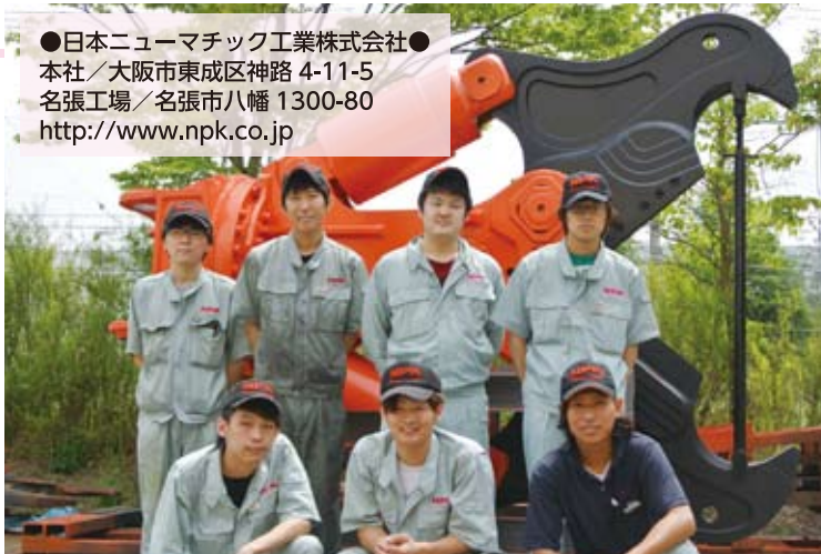
名張工場を担う若手社員たち。同社最大級の先端アタッチメントをバックに。