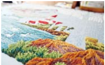
色とりどりの糸が組み合わせられ、鮮やかに仕上がっていく作品。

たのは45歳の時。夫を亡くし、気持ちも沈んでいた中「今後のために何か資格に挑戦したい」と思い立ち、師範の免許取得に挑戦。それがきっかけとなり、文化刺しゅうのとりこになったという。