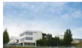
名張市東田原の同社三重工場

新製品を、いかにスムーズに製造して世に出すかが工場の「腕の見せ所」。製造機械のメンテナンスや新製品のための仕様変更が日々行われ、機械もそれを操る人も「進化」し続けている。また、若い人材が多いという同工場。人の教育を重視し、「協力会社の従業員も含めて総勢90人が力を合わせています」と意気高く語る社員たち。コミュニケーション向上に取り組み、仕事の指示以外の声掛けやプライベートでの付き合いも大切にするそうだ。ペットのトイレに関する飼い主の悩みを解消するべく、次々と生みだされる商品たち。どんなに機械技術が進んでも、そこで働く人と人が協力し合って、その供給を支えている。(PR)