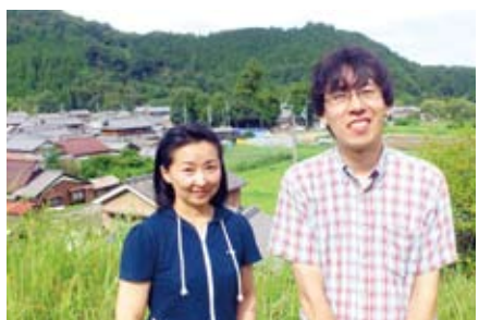
高台から見下ろした薦生の集落。

いう柳の枝を乗せていたと来より日本には「鹿養(しかかい)」という風習があり、鹿は神の乗り物として飼われてきたそうです。