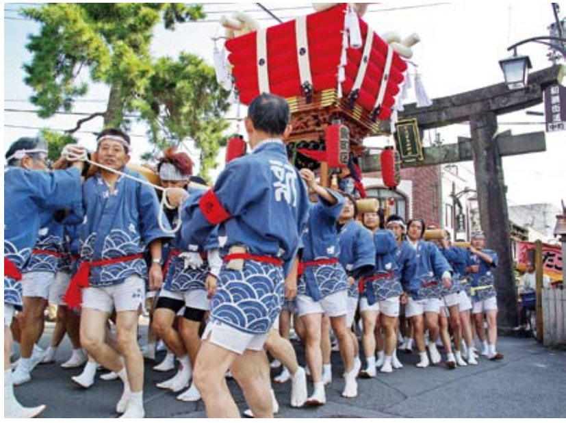
宇流富士禰神社の「一の鳥居」をくぐる新町区の大鼓台=名張市中町で