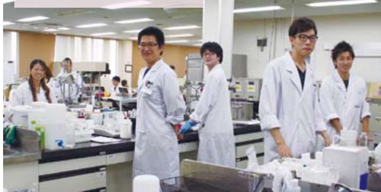
研究開発部でサンプル作りをする社員たち

●エステートケミカル株式会社● 三重県伊賀市ゆめが丘7-6-16 http://estate-g.jp/