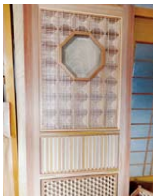
「全国建具フェア」ドア部門での入賞作品。一切くぎを使わず木を組んで作り上げられた精密な作品