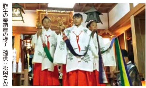
昨年の奉納舞の様子

2日間の祭りの中で、舞姫の出番は2度。11日の「宵宮」と12日の「本祭」で舞いを奉納するという。おごそかで華やかな秋祭りは、子どもたちにとっても特別な