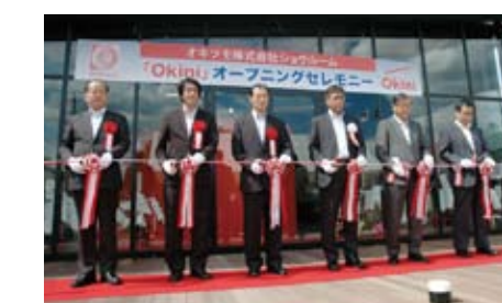
9月12日のテープカットの様子

耐熱塗料をはじめとした、機能性塗料を製造・販売するオキツモ株式会社(名張市蔵持町)は、社会のさまざまな分野や日々の暮らしの中で役立つ同社の塗料を体験できる「Okini(オキニ)」を9月12日にオープンした。同社は「小学生の社会見学など、幅広く地域の方にも見てもらいたい」と来場を呼び