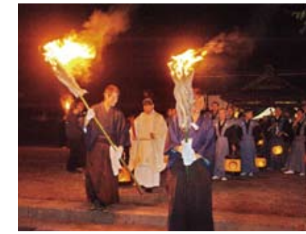
宵宮で御旅所を出発する氏子衆=名張市新町で

25日の宵宮には、新町の愛宕神社横にある「御旅所(おたびしよ)」に裃姿の氏子らが集まって祭りを祝う。その後、午後8時ごろから、宇流富士禰神社まで約2キロをちようちん片手に「ネンド、ネンド、ワイ」の掛け声とともに「大名行列」が進む。