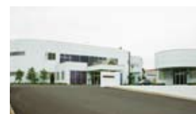
伊賀市ゆめが丘の同社

「最後の決め手は使い心地」との認識から、美容師免許を持つ社員が常駐して試作品のテストを行い、開発部メンバーの髪に施術することもあるそう。サンプルが完成して相手先のOKが出ると、量産に向けて作成テストが行われ、本製造となる。 「社長と触れ合う機会も多いし、前社長である会長も、現場で若手の指導に当たることがあります」と、フランクなムードの社内には若い社員も多く、活気がみなぎる。「高い安全性はもちろんのこと、使う人に、驚きと感動を与え続けたい」と150人の社員が心を一つに、良質の製品を生み出している。(PR)