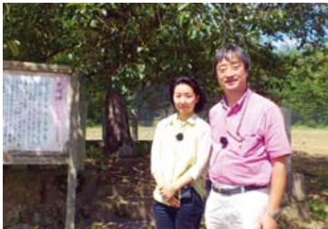
地名の由来となっている「夕部柿」=伊賀市摺見で

地名の由来となった「夕部柿」。樹齢約1200年、高さ7メートル、幹の太さは3・7メートルもある大きな柿の木でしたが、幹の部分が空洞化して、60