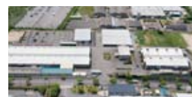
広大な敷地を持つ同社＝名張市夏見

農作業の効率化に大きな役割を果たす作業機で、農業の発展を助けてきた同社。創業からの心意気を受け継ぎ、「安全・安心な食品作りや、食料自給率の向上にも貢献したい」と、時代のニーズに即した製品開発を続ける。「地域に密着し、ユーザーさんの声に応え続けることで前進していきたい」と現場の声は熱い。(PR)