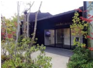
常に美しく手入れされ来客者を癒やす中庭

そのため、同ギャラリーでは、作品のそばにはタイトルや価格表示を貼らず、離れたところからまとめて展示する。常に美しく手入れされ来客者を癒やす中庭