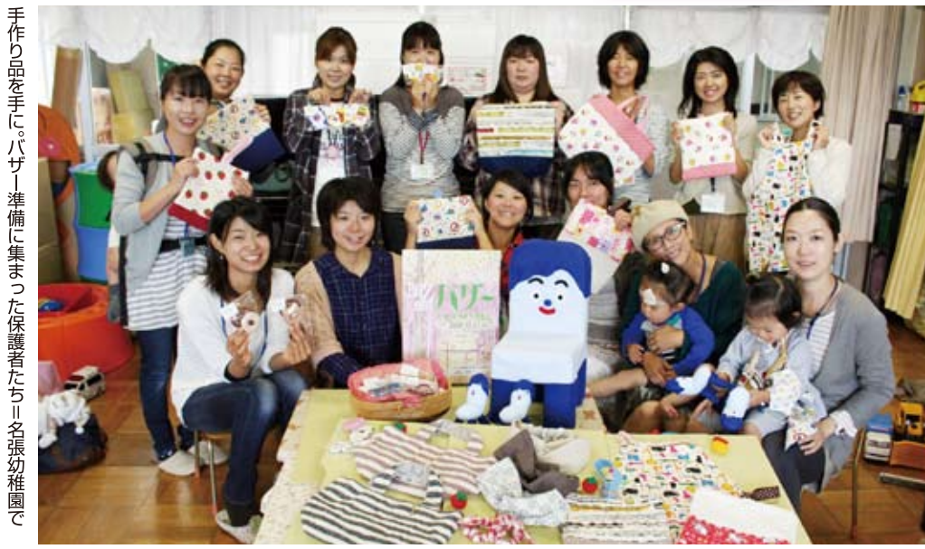
手作り品を手に、バザー準備に集まった保護者たち＝名張幼稚園で

バザーは名張市丸之内の同園遊戯室で午前9時半から11時半。問い合わせは名張幼稚園(Tel.63・3280)へ。