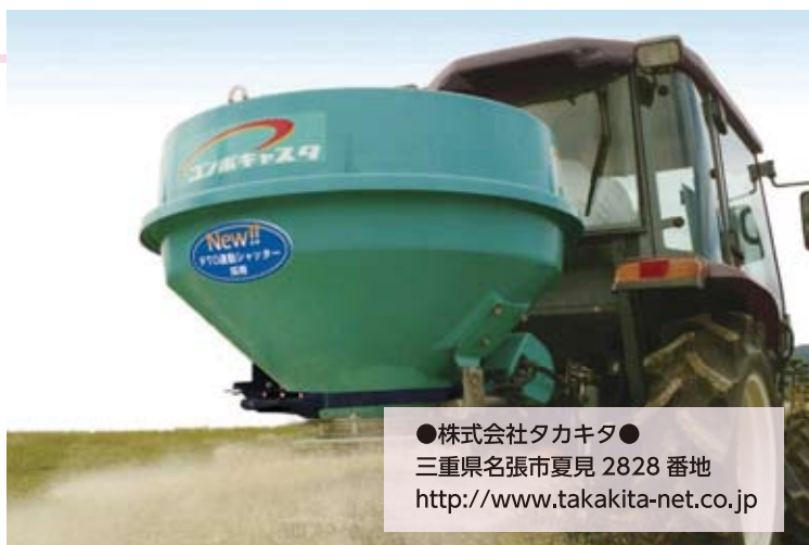
●株式会社タカキタ● 三重県名張市夏見 2828 番地 http://www.takakita-net.co.jp