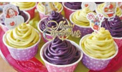
「お祝いイベントはみんなでワイワイ楽しく」が定番だそうです

デコロールは、ベースとなるケーキ生地を流した上に、色粉を混ぜた生地で絵を描いて焼き上げる。オーブンを使うと、焼くだけで数十分かかるが、フライパンを使うことで、作り始めから焼き上がりまで、