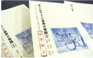
自費出版した郷土(ふる さと)と日本そして世界 の昔話の3冊