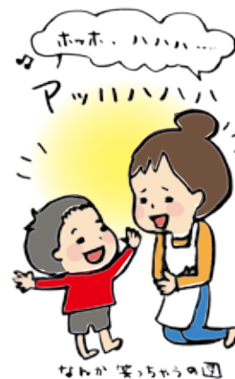
名張市笑いクラブ

「村祭り」を思い出せる人は、ぜひ自分で歌ってみて、「ホホハハハハハハハハ」と笑いの合いの手を入れる時に、身振りも付けてやっていただきたい。愉快的気分になること間違いなし。家族で顔を見合わせながらすると、きっと大笑いになると思う。私は夫婦で実験済みである。