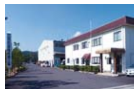
三元化成株式会社=名張市八幡

和57)年に名張市八幡で「名張工場」の操業を開始し、製造の拠点として、「均質」な製品作りをはじめ、柔らかい合成樹脂を切るなど高度な技術を培ってきた。2012(平成24)年には、経営と製造を直結させ、さらなる発展を求めて「名張工場」に本社を移転。会社設立から50年余り。技術の向上とクライアントの要望に応えるなどの企業努力もあり、同社のコンパウンドは大手メーカーの商品に使用され、業界からの信頼も厚い。さまざまな製品が生み出され、時代とともに流行色も変化していく。その流れに挑む社員たちは「希望される色を出すのが私たちの仕事です」と力強い言葉とともに胸を張る。(PR)