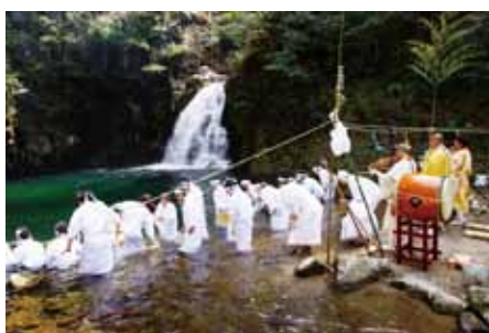
白装束をまとい滝つぼに入る参加者ら