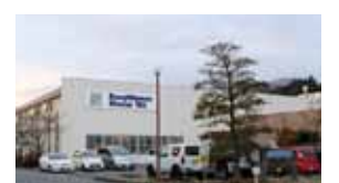
名張市八幡の本社

さらに世界各国に広がるネットワークを生かし、同社の成果を世界に発信。部署によっては英語でのメールのやり取りはもちろん、海外の工場へ技術の指導やサポートに出向くことも多いという。「海外出張が多いので、社内で英語学習の機会を設けています」と、グローバル企業ならではの取り組みも。