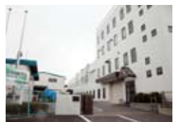
ダイヤモンドカッターの製造を担う名張工場=名張市蔵持町原出

東南アジアの国々へも出荷。高い品質から多くのファンを持つという。 約70品種製造され、ホームセンターなどにも並ぶ同社のダイヤモンドカッターの中で、社員らが「押し」と話すのが、2年前に商品化した「低騒音ナイト」。直径1寸の鉄筋が入ったコンクリートブロッコや、御影石なども切れる鋭い切れ味ながら、切断時の耳障りな高音を抑えているのが特長だ。 新たな素材の開発や技術革新で、急速に変化する建設業界。切れ味だけではなく、低振動・低騒音といった作業環境への配慮など、ダイヤモンドを使った同社製品のさらなる「進化」は続く。