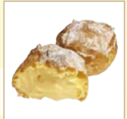
新商品の「天使のもちシュー」1個108円（税込）。餅をのせて焼きあげ、独特の食感を楽しむ