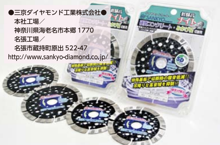
作業環境に配慮したダイヤモンドカッター「低騒音ナイト」

●三京ダイヤモンド工業株式会社● 本社工場/ 神奈川県海老名市本郷 1770 名張工場/ 名張市蔵持町原出 522-47 http://www.sankyo-diamond.co.jp/