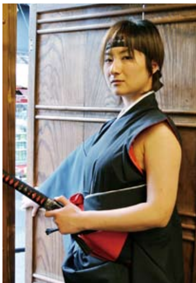
「スイッチ、が入ると、まなざしも鋭く

います。コスプレイヤーの皆さんの写真から、伊賀の魅力を発信しても「えれば」と白い歯を見せた。 伊賀の国コスプレ春の陣2015は、4月18日（土）、伊賀市の中心市街地や上野公園を舞台に開かれる。