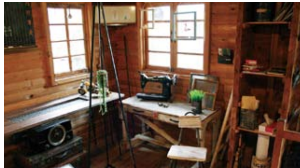
懐かしさと暖かさを感じる小物や家具

楽しくすること」を目指しているという松野さんは、「昔の家具や木材はぬくもりを感じさせてくれる」と魅力を話す。店名にある「LOHAS」とは「Lifestyles Of Health And Sustainability」の頭文字