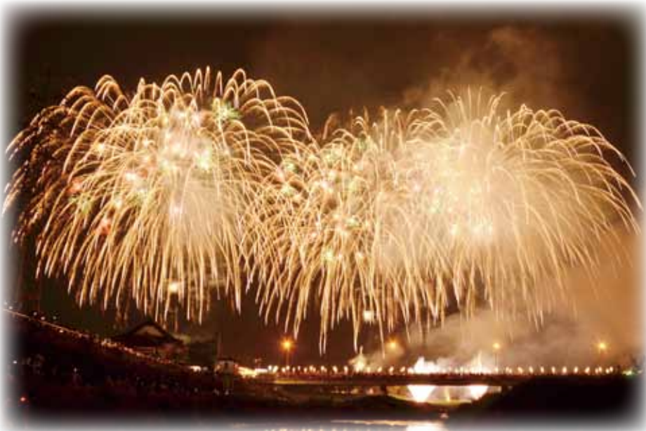
昨年の名張川納涼花火大会の様子

今では伊賀随一の夏のイベントとなっている同花火大会。仕掛け花火や文字花火の他、名勝・赤目四十八滝をイメージさせるナイアガラ、音楽に合わせたスターマインなど、夜空を彩る花火の数は5000発と、近隣最