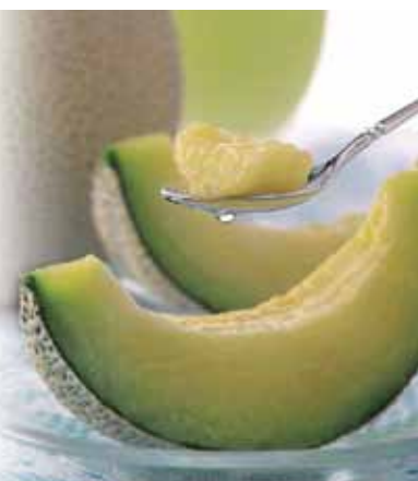
果肉は青と赤の2種類。お中元などのギフト用にと、直売所では多くの人買い求める

現在、美旗地区を中心に市内12軒の農家が参加している美旗メロンは、JA伊賀南部美旗メロン部会が栽培に取り組み。品種