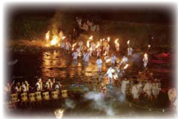
たいまつを手に勇壮に渡る(2014年撮影)

毎年、市内外から多くの見物客が訪れる「名張川納涼花火大会」。その花火大会の幕開けを飾るのが、「愛宕(あたご)の火祭り」です。