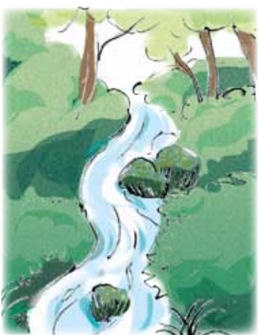
きれいな水に感謝

東近江市の愛知川を河口から源流にさかのぼって、土地の物産をその生産にたずさわる人々の声と共に紹介していく。ヨシズのすだれ、近江ちぢみ、ごろうがめ汁、永源寺こんにゃく、フナの刺身、水だし玉露などの紹介があったが、いずれも土地の長い伝統を継いだ産物である。その全てが、愛知川の清流ときれいな地下水のおかげで生き続けてきたのだが、從事している人々が皆異口同音に「水への感謝」を語っていた。土地の人々にとっての「きれいな水」の存在感の大きさが伝わってきた。そして「水への感謝」はまた、それとともにある「生活への満足」を表しているように思われた。自然の命とつながって生きており、その感謝の心が、生活を支え、生活を誇りに思う気持ちにつながり、それが深い笑顔になって表現されているのだらうと思わせられた。