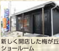
新しく開店した梅が丘ショールーム

TEL 0120-683-445 名張市梅が丘南2-276 (梅が丘ショールーム) 9:00~16:00、年中無休