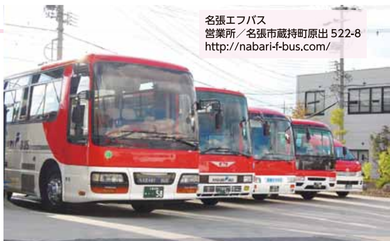
名張エフバス 営業所／名張市蔵持町原出 522-8 http://nabari-f-bus.com/