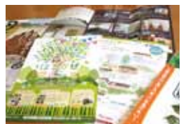
美山さんがデザインしたパンフレット

29歳でフリーランスとなり、出産後は子育てをしながら仕事をこなし、自営という。「自由に時間を使うことができたのは、結果的に良かったかも」とこれまでを振り返る。「中身ももちろん重要ですが、見た目が買わせる力になります。その「つかみ」をする