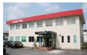
蔵持町にある営業所

また、安全面に重点を置き、情報共有のミーティングや運転技術の教育をはじめ、事故防止研修にも力を入れる同社。「訓練を重ねて心に余裕と自信を持つことが、お客様の信頼獲得につながる」と話す。