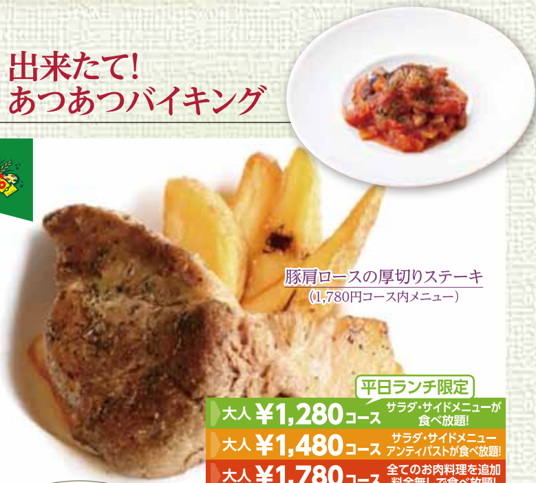
豚肩ロースの厚切りステーキ (1,780円コース内メニュー)