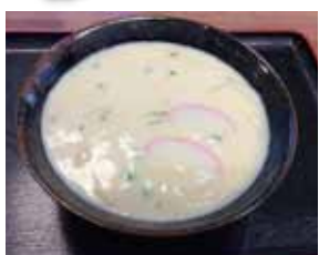
リピーターも多い「牛乳うどん」