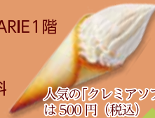
人気の「クレミアソフト」は500円(税込)