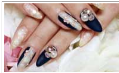
松岡さんが施したネイル。「ラインストーンやパールなどの装飾は指先のアクセサリ」

主に、手のマッサージや角質の除去といった爪のケアと、ジェルネイルなど爪の装飾をします。また、資格取得を目指す方のネイルスクールも開いています。