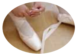
「名張市武道交流館いきいき」や「ハイトピア伊賀」での1回500円「ワンコインレッスン体験」も好評