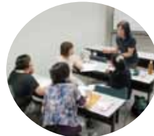
講義は和気あいあいとした雰囲気。グループワークやロールプレイングなどの演習も