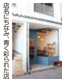
店名にちなみ、青く彩られた店