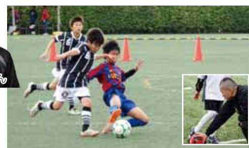
コートはプロ仕様人工芝(インドア)。2017年にブラジル本国遠征を実施予定

◆ 入会金10,000円 ◆ 年会費5,000円 ◆ 受講料(クラスにより変動します) 週1/5,600円、週2/7,600円 ※料金は全て税抜 【クラス】年中~小学2年生(KIDSクラス)、小学3年生~小学6年生(U-12) 中学生以上(Over-12)、ジュニアユース