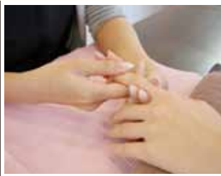
指先のケアとして念入りなマッサージも