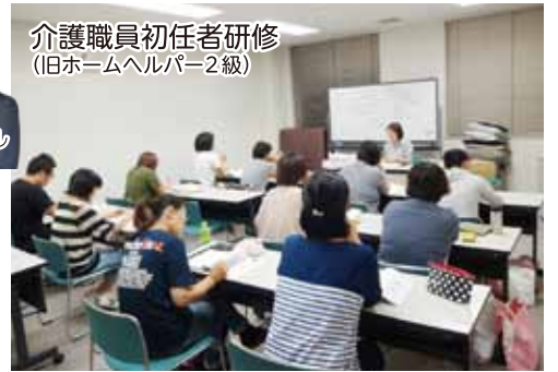
介護職の入門資格を取得できる講座「介護職員初任者研修」。修了後すぐに介護職就職OK。夜間通学コース(月・木曜の各3時間)は、71,280円(税込)。3月31日までに、電話かHPで申し込みを