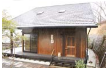
気候の良い時期は、デッキにテーブルも