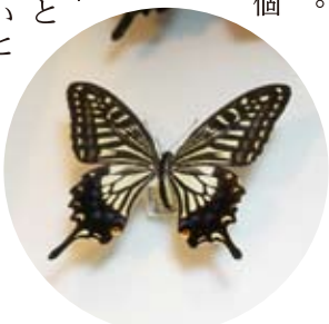
丁寧に展覧されたチョウの標本

「今年はおオムラサキやヒサマツミドリシジミも採りに行きたい。オトシブミとかチョウ以外も作りたいな」と昆虫博士の興味はまだまだ尽きない。