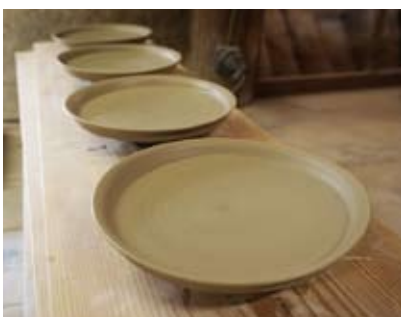
福森さんによって成形された皿

自身の窯を作り、より器作りに熱が入るようになった。「火と向き合って作る瞬間が楽しい。これからは自分の窯で、自分が作りたと思う器をもっと作っていききたいですね」と目を輝かせた。