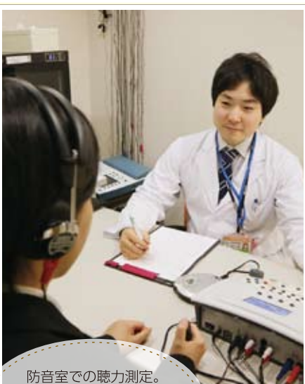
防音室での聴力測定。音の聞こえ、言葉の聞き分け、不快に感じる大きさのレベルを測る

出無精になっていた方が「みんなの話に入っていけるようになった」と喜んでくれた時はうれしかったです。また、ご家族から感謝されると励みになりますね。