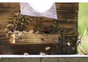
巣作りに集まるニホンミツバチ(昨年4月撮影・本人提供)

在8人。自作の「重箱式巣箱」と呼ばれる、複数の木枠を積み重ねた巣箱で飼育を行う。ラン科シユンランの花はニホンミツバチを引き寄せる匂いがあるため、同花を巣箱の横に設置。毎年4月頃に匂いに集まったニホンミツバチが巣作りを始める