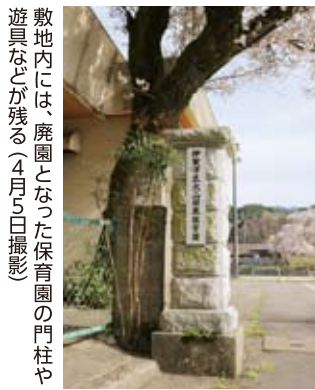
敷地内には、廃園となった保育園の門柱や遊具などが残る(4月5日撮影)

「地域の食の拠点として残したい」。阿波地区に住む女性たちが発起人となって、廃園が決まり解体予定だった保育園舎を再利用してオープンした。「店名は、『将来の阿波(あわ)地域を展望(てんぼう)する活動』との思いから」と、