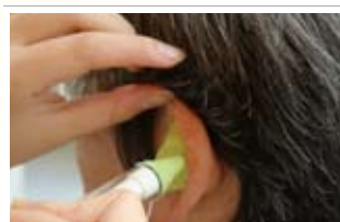
時には、オーダーメイドの補聴器を作るため、専用のシリコン素材で耳型をとることも