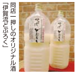
同店「押し」のオリジナル酒「伊賀流どぶろく」

DNA解析で あなたに適切なダイエット法をご提案! わずか2カ月で 「理想のカラダ」へ この夏、自信の持てる体へ。 まだ間に合います!