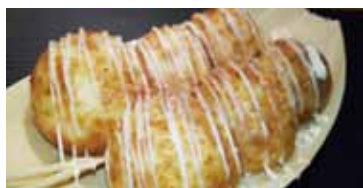
大きさが自慢のたこ焼き。「塩マヨ」トッピング