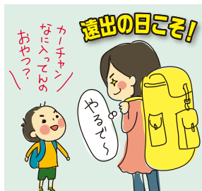
おむつが取れた日

息子が2歳を過ぎた頃、私の頭の中は息子のおむつを取ることでいっぱいでした。不快なおむつをできるだけ早く取るために、100%布おむつで育て、生後6カ月から小さなおむつを使ってきた私。おむつは2歳までに取れると思い込んでいました。というのも、私の母は満州で生まれたのですが、私は祖母から「日本に引き上げてきた時に、あなたのお母さんは2歳になったばかりやったけど、おむつ取れてたから、ほんまに助かったんや」という話を何度も聞かされていたのです。しかし、息子の2歳の誕生日(4月)を迎えても、なかなかおむつは外せず。夏になり、家にいるときは長めのTシャツを着せるだけで下は何もはかせないで、部屋の隅に常におまるをスタンバイ。行きたくなったらすぐに座れるようにしました。床を何度拭いたことか……。そして気付けば秋、私たちは保育所の親子遠足で鳥羽水族館に行くことに。私はあえておむつを持っていかずに着替えを山ほど持っていきました。遠足中3回は漏らしたと思います。ほんとに大変でしたが、なんと次の日からピタッとパンツを濡らすことがなくなったのです。「遠足の時は、おむつでいいわ」と思いがちですが、実は「遠足の時こそパンツ!」。あの日がおむつが取れた日と確信しています。