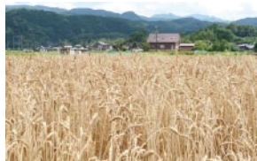
店の近くにある、刈り取りを待つ麦畑(6月21日撮影)