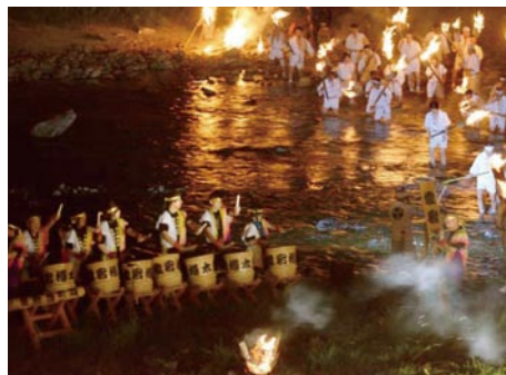
たいまつ川渡りの中で演奏される樽太鼓