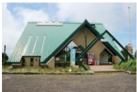
グリーンを基調とした独特の三角屋根