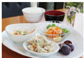
旬の野菜を使ったヘルシーな日替わりランチ