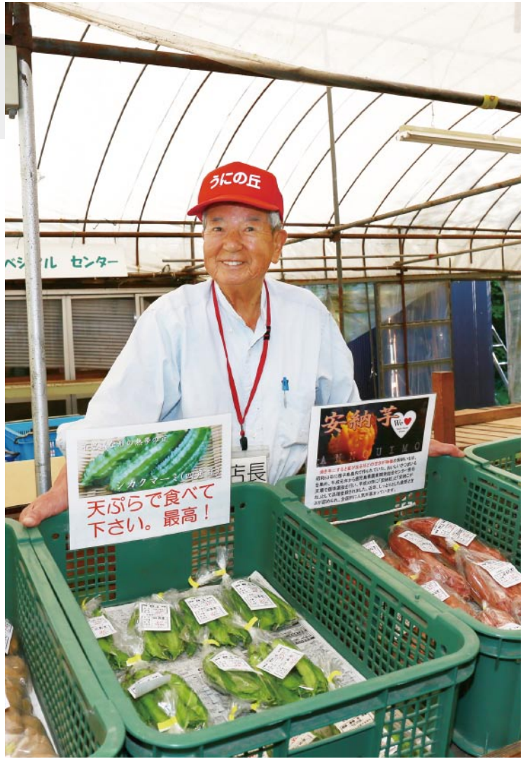
「野菜も果物もおいしくて、お買い得ですよ」と笑顔の福森店長