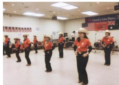
イベント時は、カントリー曲だけでなく、演歌やポップスに合わせて踊ることも

練習の成果は、伊賀地域を中心に、イベントなどで披露。11月3日には、伊賀市川合で開かれる「けんずいまつり2016」に出演予定だという。森林さんは「いつもみんなで楽しく踊っています。これからも、いろいろな場所で披露していけたら」とこやかに話した。