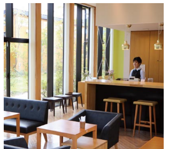
大きな窓に囲まれた店内からは、四季折々の庭の風景が楽しめる

名張市立百合が丘小学校の隣、ギャラリーなどの施設の一角に「Cafe 輪」がある。ランチやデザートが主婦らに人気。ギャラリー目当てに遠方から訪れる客も多く、「食欲の秋」も「芸術の秋」も満喫できる」と評判だ。オープンした2012(平成24)年。