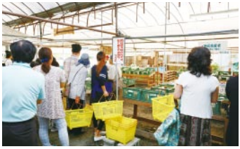
オープン直前の時間に並ぶ人々

が、本当にうれしいです。すねと話すと福森さん。収穫シーズンの売り場は安心で新鮮な野菜を