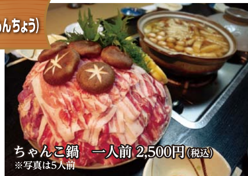
ちゃんこ鍋 一人前 2,500円(税込)

地元客に愛されて14年目を迎えた同店。今年のイチオシは、鶏ガラスープに人気の「あごだし」が入って、贅沢な味わいになった「ちゃんこ鍋」です。その他一品メニューにも、店主が目利きした新鮮食材が並びます。ゆっくり飲みにも接待にもぜひどうぞ。