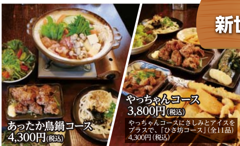
あったか鳥鍋コース 4,300円(税込)