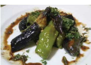
「自分が安心できる食材で」。自慢の料理に使う野菜には、自身で育てたものも

自信作は、かつて店で人気だったアボカドとパクチーを使ったメニュー。「当時の味を踏まえながら、『こんな食べ方もあるんだ』