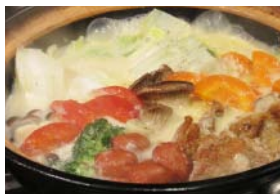
伊賀の食材たっぷりの「クリーム鍋」。4人から楽しめる