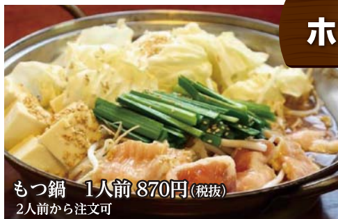
もつ鍋 1人前 870円(税抜) 2人前から注文可

こだわりの味噌スープに、もつや野菜でボリューム満点。しめに雑炊、ラーメン、うどんもお勧め(別途料金)