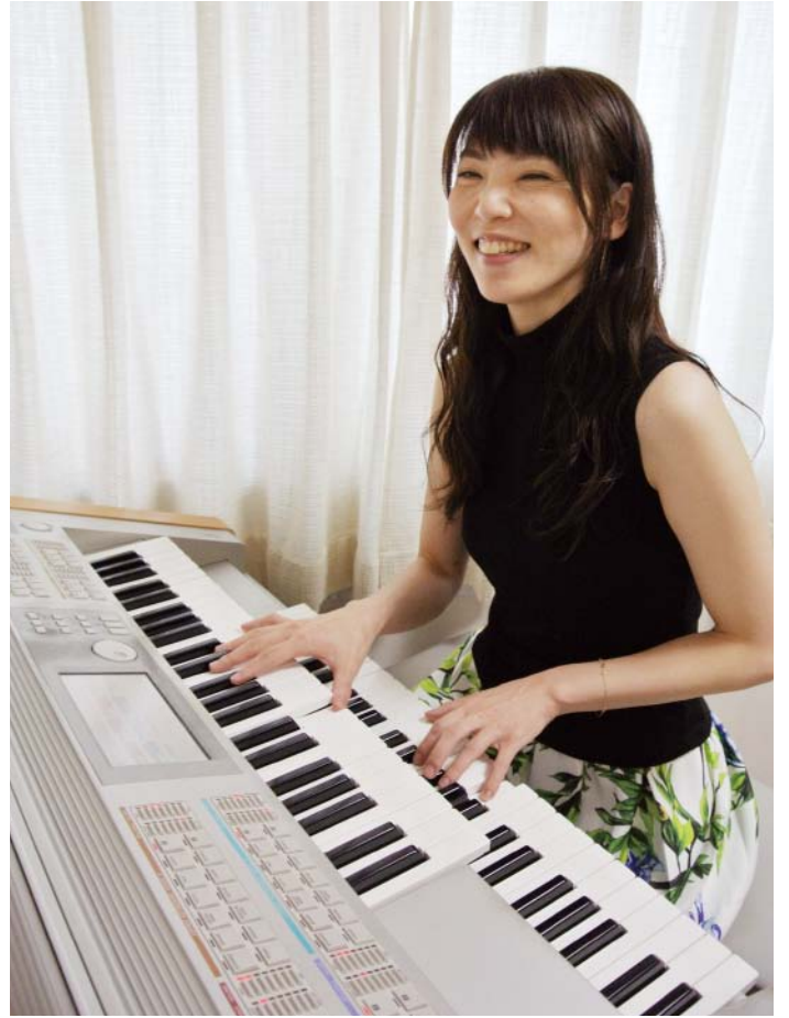
「音楽でいろんな人とつながることができた」と笑顔のかなたさん