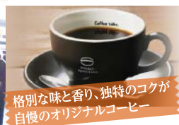
格別な味と香り、独特のコクが自慢のオリジナルコーヒー