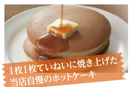
1枚1枚でいねいに焼き上げた当店自慢のホットケーキ