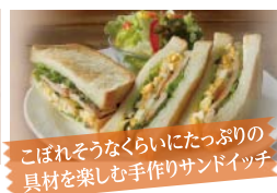
こぼれそうなくらいにたっぷりの具材を楽しむ手作りサンドイッチ