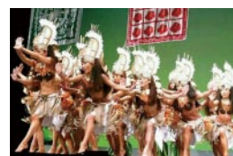
昨年のコンペ「ハイヴァイ オオサカ」の様子

抽選の模様を4月7日(金)の夕方、FMなばり83.5MHzで放送します。当選発表では、ペンネームまたは名前のイニシャルを読ませていただきます。