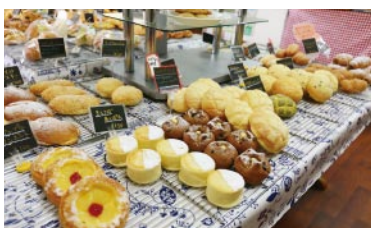
店内にはさまざまな種類のパンが並び

た」と話す。さらに「これからも地域に愛されるパン作りを続けていきます。今後は外にイートスペースなども作って、お客さんにもっと親しんでもらえる店作りをしていきたいですね」と思いを語った。