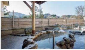
温泉は露天風呂の他、掛け流し源泉風呂や寝湯も楽しめる

販売などを担当。温泉上がりの癒やしを届けている。生まれも育ちも島ヶ原で、「生粋の『島ヶ原の癒やし』を届けている。生まれも育ちも島ヶ原で、