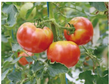
ハウスの中で大きく実ったトマト

実際に農業を始めるにあたって必要なノウハウを学ぶ場所を探していたところ、同市短野地区