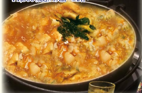
おかえりセット(¥380以下のドリンク付)