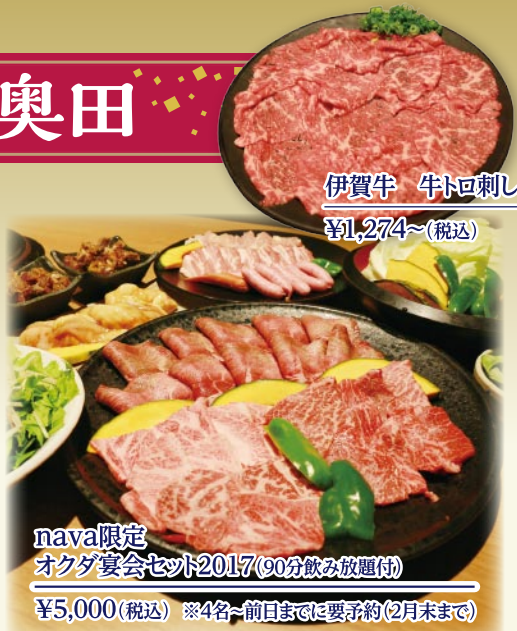
伊賀牛 牛トロ刺し