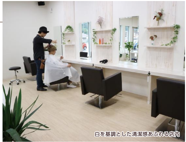
白を基調とした清潔感あふれる店内

1年前まではオークワパークシティ名張店内に出店していた同店。新店には、その時からの常連客も多いという。中には親子3世代で利用している客もあり、幅広い世代に親しまれている。 カットはもちろん、頭皮と髪のケアが一度にできるヘッドスパも好評の同店は、市民に愛される「癒やしの空間」づくりを目指している。子どもから大人まで対応できるよう、気配りも欠かさない。