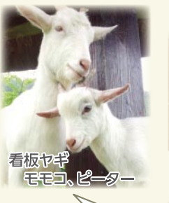
看板ヤギ モモコ、ピーター