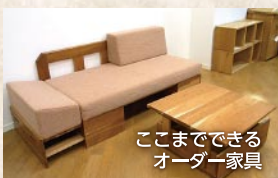
ここまでできるオーダー家具