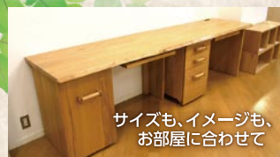
サイズも、イメージも、お部屋に合わせて