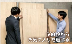
500枚からお気に入りを選べる