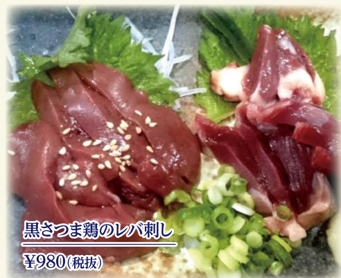
黒さつま鶏のレバ刺し