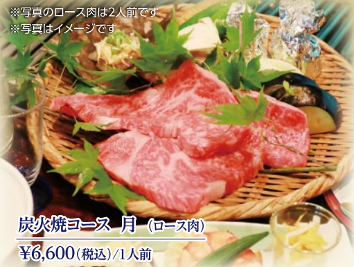
※写真のロース肉は2人前です ※写真はイメージです