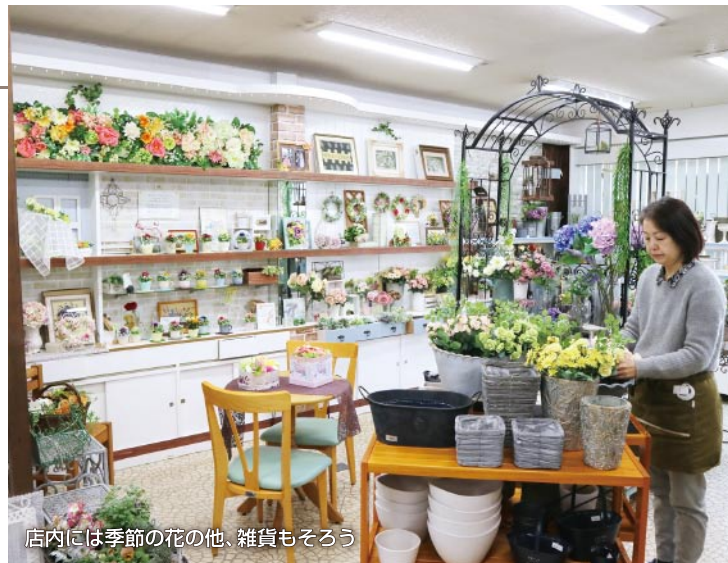
店内には季節の花の他、雑貨もそろう

2009(平成21)年にオープンした同店のこだわりは「飾る時と同じ条件」で販売すること。温度変化を極力減らすことで、「生花の持ち」が良くなること、花を冷やすショーケースが無い店内では花畑に居るかのようになり甘い香りに包まれる。また、生花は全て予約販売。予約に合わせて仕入れるなど、鮮度への気配りも欠かさない。