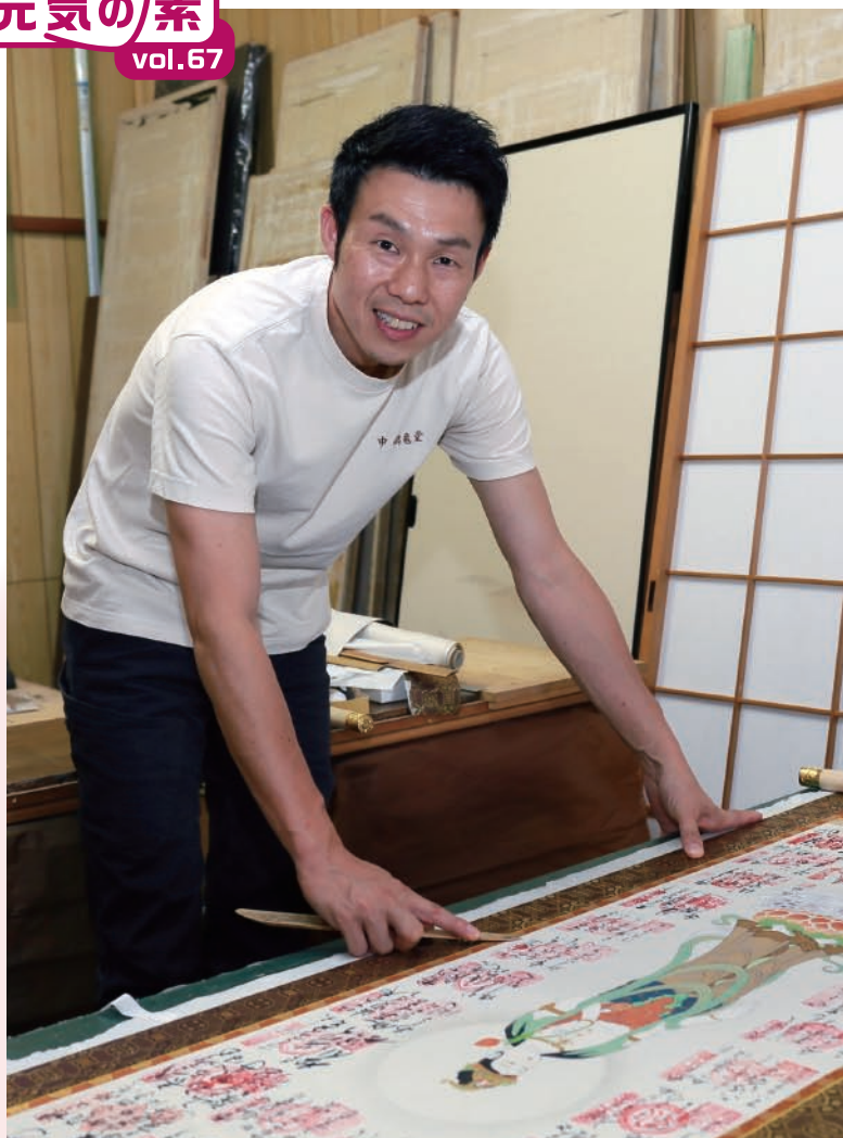
作業場で仕事に励む中さん=名張市希中央の本社で