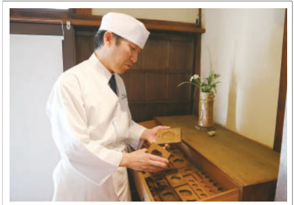
先代から受けついで木型がズバリ。季節を感じるさまざまなデザインが施されている

「自分の手から生まれる、手間暇かけたものを知ってもらいたい」という思いから、菓子は一つひとつ手仕事で、全て一人で作っています。和菓子の食材なども、人との出会いやつながりから、自分で確かめたものを使います。季節感を大事に、伊賀の「おいしいもの」を和菓子に詰めていきたいですね。