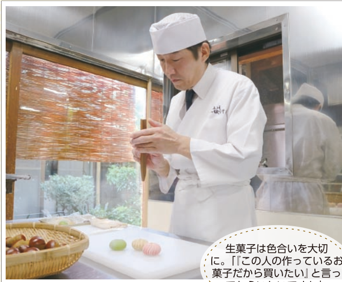
生菓子は色合いを大切に。「この人の作っているお菓子だから買いたい」と言ってもらいたいですね

これまでは、職人として作ることに専念していましたが、近年はイベント出展やSNSでの発信などから生まれる、お客様との触れ合いが楽しいですね。じかに声を聞くことで、刺激を受けたり情報をもらったりして、新しい菓子作りへのエネルギーにもなっています。