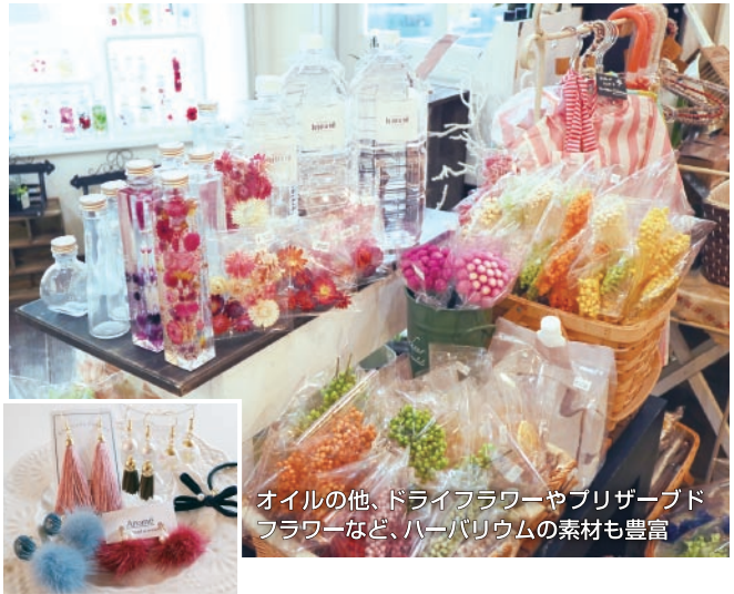
オイルの他、ドライフラワーやブリザーブドフラワーなど、ハーバリウムの素材も豊富

名阪国道・治田インター近くに店を構えるのは、「雑貨&flower Pepper berry」。季節を彩る花々や可愛らしい雑貨が並び同店には、「自分の癒やしに」「プレゼントに」と多くの女性たちが訪れている。